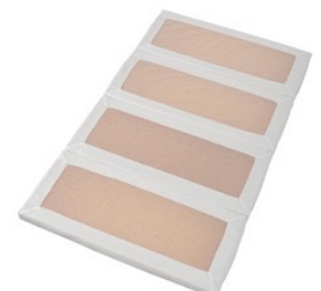
敷きふとん用中材