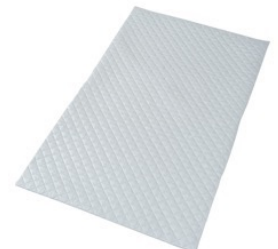
防水パッドシート