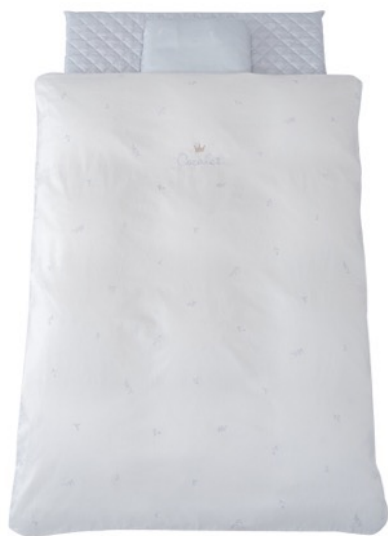
「Cocolet ベビーふとんセット クラウンリーフ」

廃棄米や非食用米をアップサイクルしたエコ素材「RICEWAVE®」採用の 『Cocolet ベビーふとんセット クラウンリーフ』が11月23日から新発売！